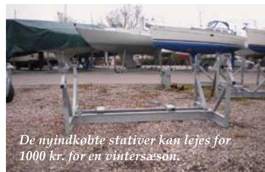
De nyindkøbte stativer kan lejes for 1000 kr. for en vintersæson.

Så har vi endelig fået vores spuleplads færdiggjort, og det ser ud til, at den fungerer rigtig godt. Pladsen er indrettet med aqua dren til afledning af spulevand fra pladsen, der fra løber vandet ned i en bundfældnings