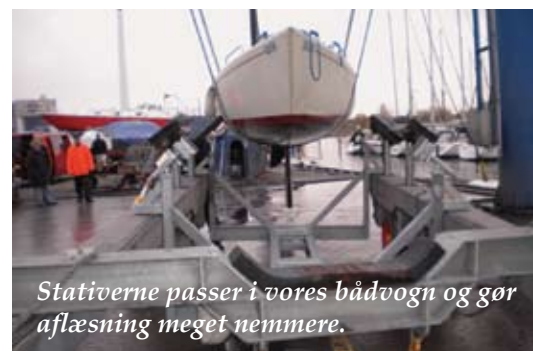
Stativerne passer i vores bådovogn og gør aflæsning meget nemmere.