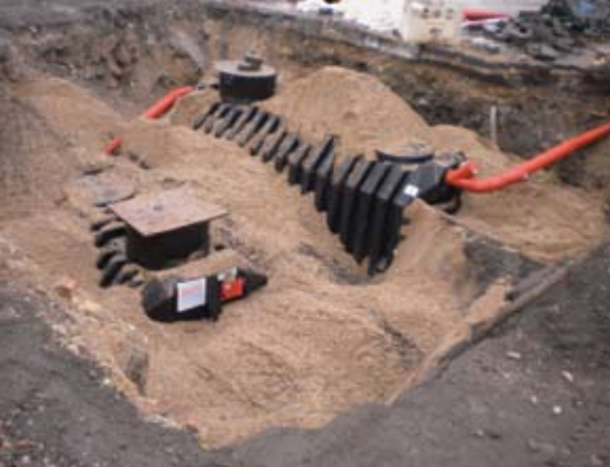
Akkumuleringstank og sandfilter til spuleplads. Filtret renser vand før det pumpes ud i havnen igen. Skittet bundfælder sig i tank.