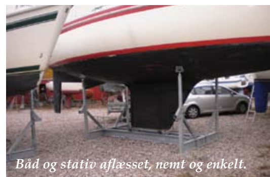
Båd og stativ aflæsset, nemt og enkelt.