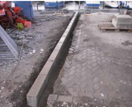
Der laves opkant, så vandet bliver nede i kanalerne, som fører ned i tanke og ikke forurener.

tank, som er på 5000 liter. Her skal de store partikler bundfælde sig. Fra bundfældningstanken løber vandet videre til et sandfilter og derfra i en pumpebrønd, som pumper det rensede vand i havnen.